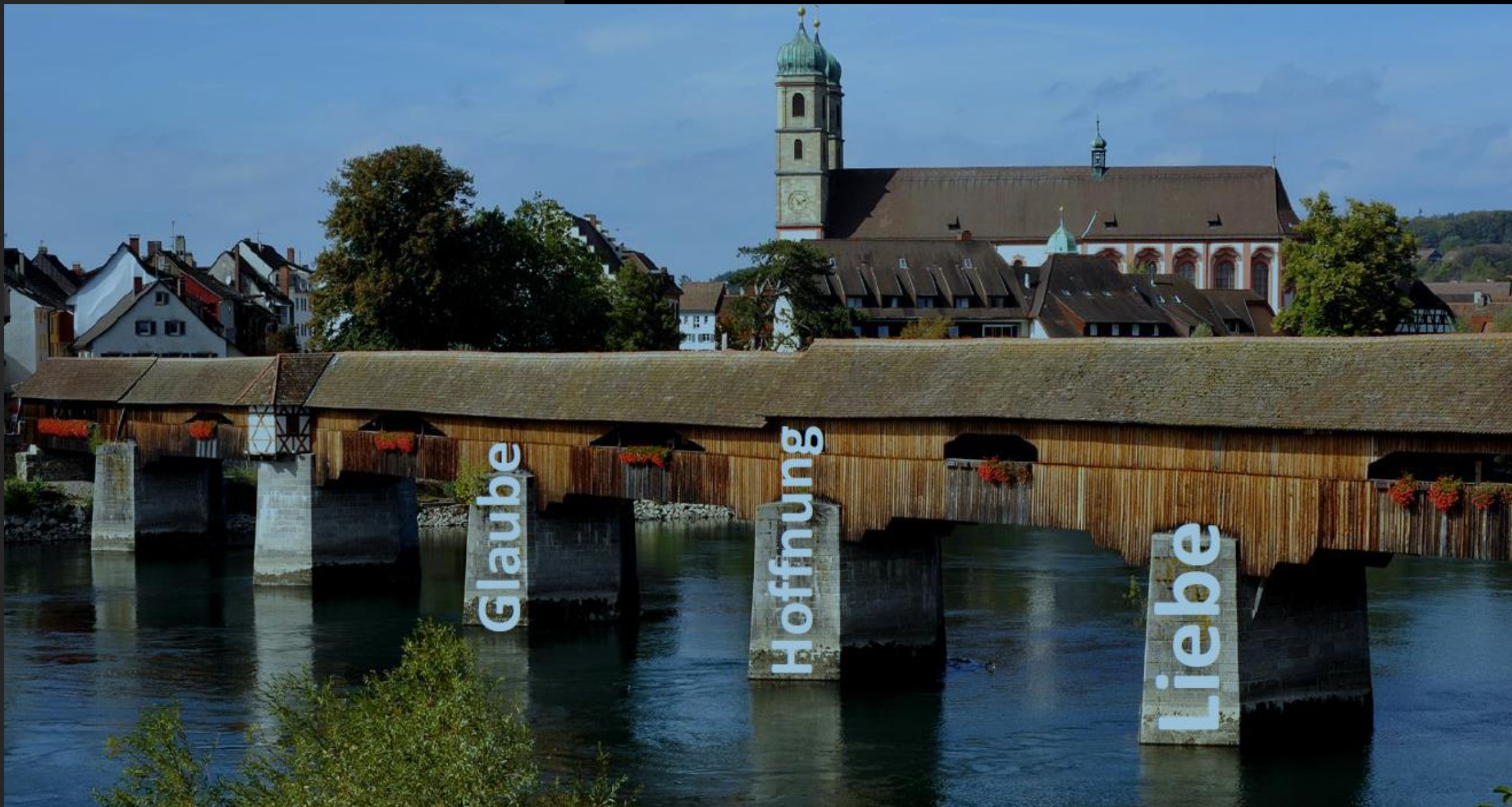
Holzbrücke Bad Säckingen